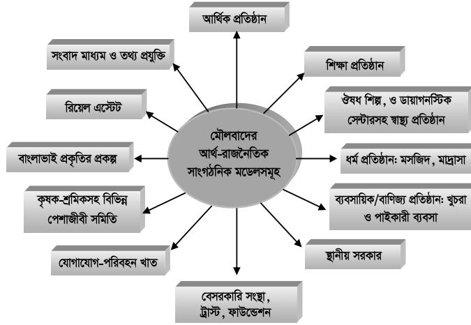
ছক ১: মৌলবাদের আর্থ-রাজনৈতিক সাংগঠনিক মডেল